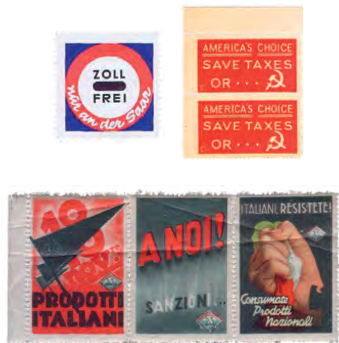
Vinhetas filatélicas políticas alemãs (plebiscito do Sarre), italianas (contra as sanções após a invasão da Etiópia), americanas (contra os impostos) e romenas (feitas por exilados anticomunistas).